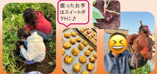
掘ったお芋はスイートポテトに♪

つばみだよりでは、皆様からの作品をお待ちしています。文章や写真、絵など発表したいものがあれば職員までお知らせください。また、ご感想も是非お寄せください。